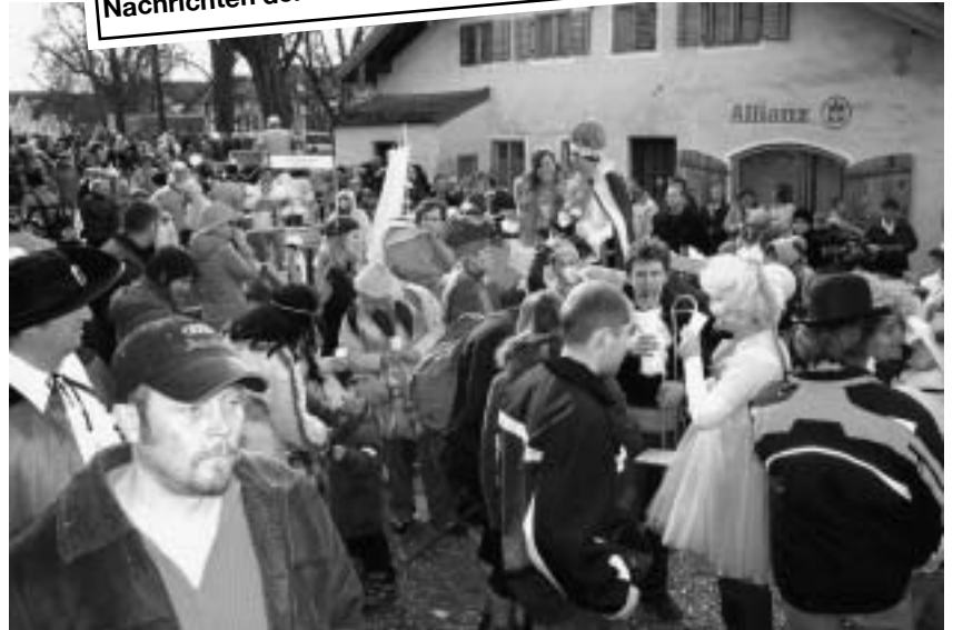
Prächtige Stimmung herrschte beim Faschingsumzug 2008.

Das Starkbierfest findet seit 2002 alle zwei Jahre im Wechsel mit dem Kappenabend statt. Zusammen mit den Fußballern des TSV Isen wird es in der Mehrzweckhalle Grottenau, besser bekannt als „alte Turnhalle“, durchgeführt. Höhepunkt ist dabei die Fastenrede von Bruder Isenator. Erinnert sei hier an die hintersinnige Wahlanalyse von 2008, als er die rund 400 Besucher zu einem gemeinsam skandierten „Wir sind Fischer“ bewegen konnte. Daneben gibt es Sketch-Einlagen und die berühmten Gstanzl. Auch hier gilt es wie beim Kappenabend, die Gradwande-