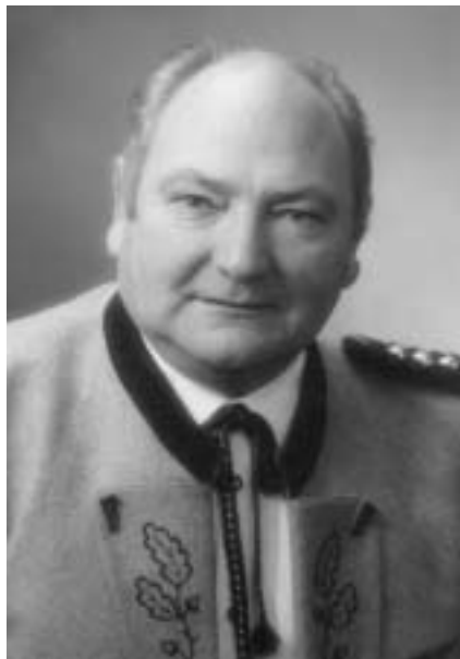
Isen, im Januar 2010