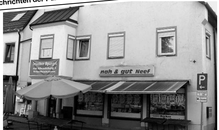
Ehemals Hofwirt, das Geburtshaus Lechners.

Anschließend wirkte er als Canonikus und Stiftsprediger am Kollegiatstift Mühldorf am Inn, das schon seit 1610 mit einem Dekan und sieben Chorherren bestand und am 2.