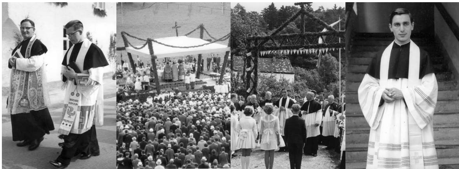
Impressionen von den Primizien 1962