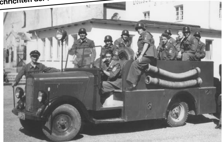
Opel Blitz 1955

Dieser Opel Blitz ist ein Feuerwehrfahrzeug, das noch heute bei vielen Mitgliedern der Freiwilligen Feuerwehr Isen nostalgische Gefühle wachrüttelt, von den Holzsitzen bis hin zur Gangschaltung am Lenkrad. Daher wollen wir den 50. Geburts- bzw. Erstzulassungstag dieses Fahrzeuges, das einen nicht unbeachtlichen Teil der letzten fünfzig Jahre der Freiwilligen Feuerwehr Isen mit geprägt hat, zum Anlass nehmen, auf die Geschichte dieses Fahrzeuges zurückzublicken.