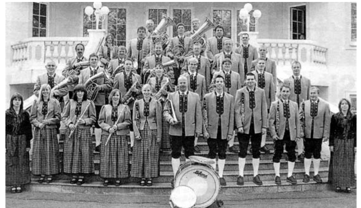
Die Musikkapelle Ernstbrunn ist für ihre tollen Leistungen weithin bekannt.

2011 musste festgestellt werden, dass der Proberaum aus allen Nähten platzt. Um aber die musikalische Qualität zu steigern, ist ein geeigneter Proberaum notwendig. Daran wird derzeit gearbeitet. Ein großes Dankeschön gebührt allen Gönnern, Unterstützern des Vereins sowie den fleißigen Vereinsmitgliedern der Musikkapelle Ernstbrunn.