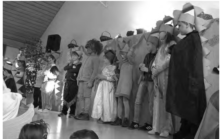
Auftritt der Hortkinder

Mit einem gemeinsamen Abschlusstanz und -lied klang ein fröhlicher Nachmittag schließlich aus. Das Kindergarten- & Hortteam bedankt sich herzlich beim Elternbeirat u. allen Helfern, sowie für die Speisen u. Kuchenspenden.