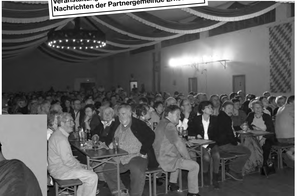
Seit 2002 ist das Isener Starkbierfest in der Alten Turnhalle ein Zuschauer magnet.

Das Starkbierfest findet seit 2002 alle zwei Jahre im Wechsel mit dem Kappenabend statt. Zusammen mit den Fußballern des TSV Isen wird es