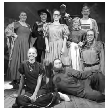
Unsere Schauspieler freuen sich auf zahlreiche Besucher.

sich kein Märchen mehr so vorlesen, wie man es kennt, weil alle Seiten durcheinander geraten sind und sich im Märchenbuch nicht mehr an der richtigen Stelle befinden. „Eine Katastrophe“, nennt es Frau Holle und hat schon eine Lösung parat: Flugs schickt sie die Katze in die Welt, damit diese die Gebrüder Grimm suchen, die sich auskennen, weil sie ja die Märchen geschrieben haben. Freuen Sie sich auf eine turbulente Märchenkomödie, die besonders jüngere Besucher und Märchenspezialisten anspricht.