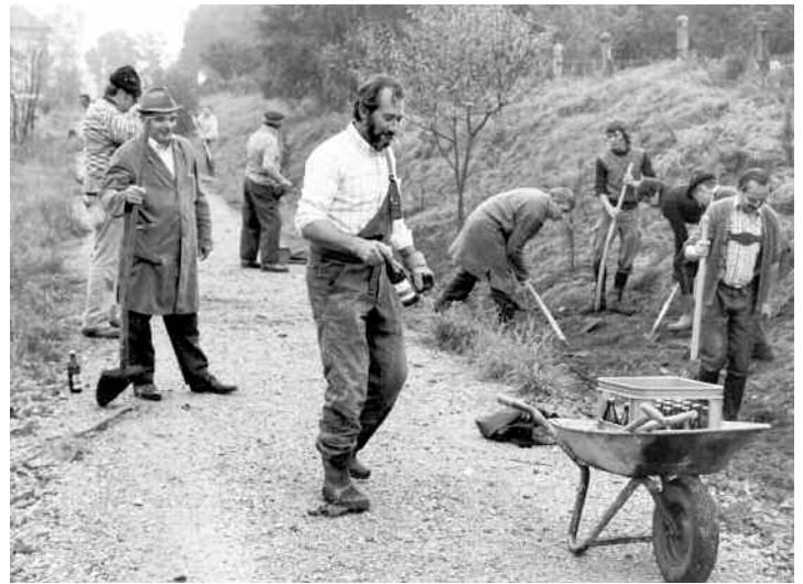
Die Arbeiten am Bahndamm durch die Vereinsmitglieder, dem heutigen Rentnerweg.

Bereits 1909 war ein „Obstbau- und Bienenzuchtverein“ entstanden, dem zunächst 35 Mitglieder angehörten. Dieser Verein existierte mit einer kurzen Unterbrechung (1921–1924) bis 1933, dann wurde er durch die Nationalso-