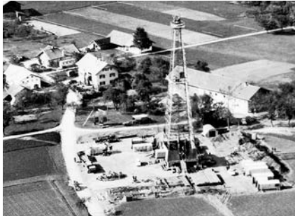
Bohrturm in Lichtenweg-Schnaapping

Aufgrund der Landschaftsentstehung des ehemaligen Meeres-Molassebeckens vermutete man auch in unserer Gegend Bodenschätze. In Lichtenweg wurde deshalb in den 1950er Jahren auf der Wiese vom „Schwob“ ein Bohrturm errichtet. Vom Team der „Erdölboh-