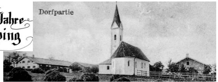
Links der Kirche von Schnauppung: Bauernhof „Pauli“, Rechts der Kirche: Bauernhof „Gammerl“

grundstück überlassen, auf welchem er sich seinen eigenen Hof errichtete. Dieser erhielt den Hofnamen „Wies-Pauli“. Das Schnauppinger Anwesen „Pauli“ nennt man mittlerweile „Bai“.