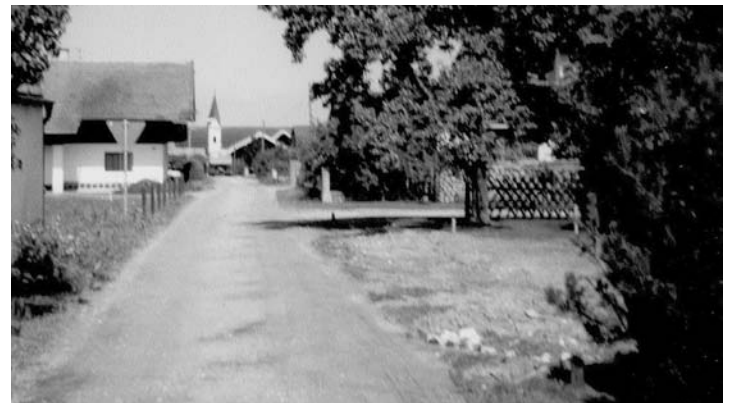
Kiesstraße von Lichtenweg nach Schnaapping

Allein in Lichtenweg befanden sich 1960 noch elf landwirtschaftliche Anwesen: In Schnaapping besaßen alle drei Grundstückseigentümer eine Landwirtschaft. Im Lauf der Jahre stellten viele landwirtschaftliche Betriebe ihren Milchviehbetrieb ein. Manche betrieben noch Ackerbau oder Forstwirtschaft weiter. Die Gründe für das Aufgeben der landwirtschaftlichen Betriebe waren unterschiedlich. Im Jahr 2026 gibt es in Schnaapping/Lichtenweg nur noch zwei große landwirtschaftliche Hofbetreiber.