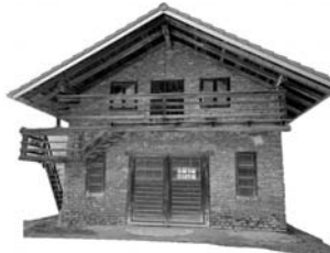
Schmiede von Schnauppung