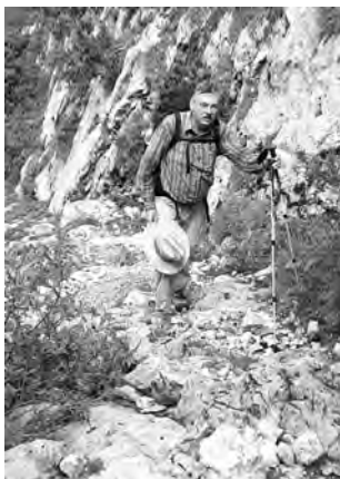
Aufstieg zur Tissihütte

Am 4. Tag hatten wir wieder eine sogenannte schwarze Strecke zu bewältigen. Wir mussten von 1000 Meter Höhe auf 2250 Meter zur Tissihütte aufsteigen. Der Weg führte einmal mehr über Geröll und Steige. Belohnt wurden wir dann aber durch einen herrlichen Ausblick auf die zurückgelegte Wegstrecke der letzten Tage. Vor uns hatten wir jetzt das Massiv der Civetta.