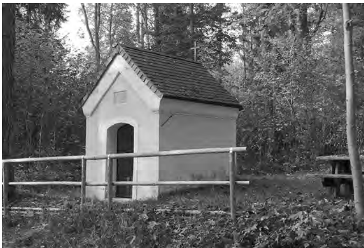
Die Zeno-Kapelle in Kirchstett